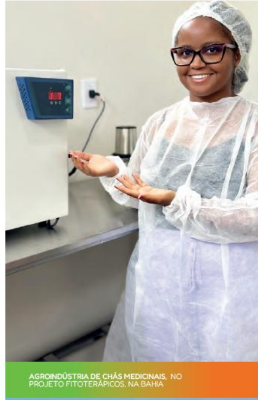
AGROINDÚSTRIA DE CHÁS MEDICINAIS, NO PROJETO FITOTERÁPICOS, NA BAHIA.

A proteção dos biomas é decisiva para um futuro sustentável. A Humana Brasil atua junto a comunidades promovendo a restauração ecológica de áreas degradadas, o monitoramento e apoio à gestão territorial, além do uso sustentável dos recursos naturais. Essas iniciativas fortalecem a proteção e a resiliência dos biomas, aumentam a biodiversidade e geram benefícios sociais e econômicos, como o aproveitamento de plantas medicinais na Mata Atlântica. Por meio dessas ações, as comunidades promovem transformações duradouras, fortalecendo decisões coletivas, conscientes e sustentáveis.